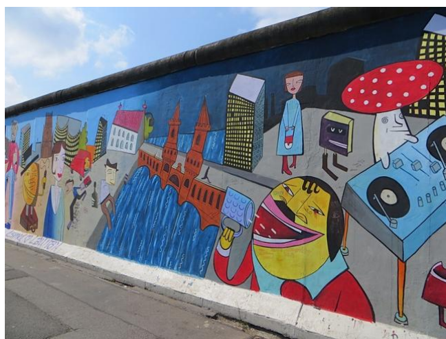
East Side Gallery : malheureusement les tagueurs n'épargnent pas ces œuvres d'art qui ornent le principal tronçon encore debout du mur de Berlin.