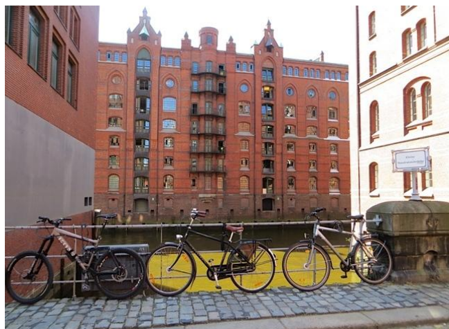
Mode de transport fréquent, des vélos garés devant le canal et les entrepôts de l'impressionnant quartier de la Speicherstadt à Hambourg.

Vendredi matin, balade dans le parc du château de Charlottenburg avant une croisière sur la Spree pour voir Berlin autrement. Les couvre-chefs de toute nature