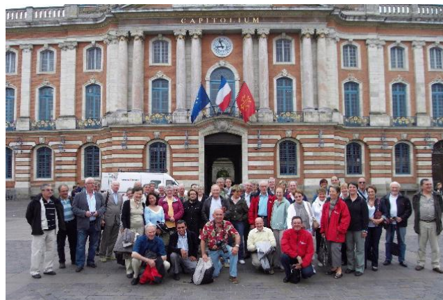
Les Masters posent devant le Capitole.