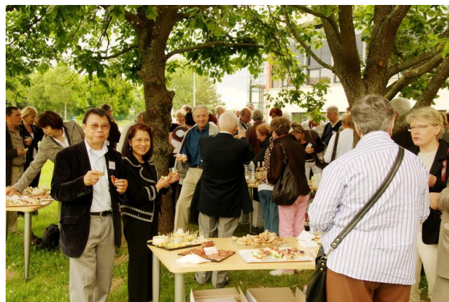
Déjeuner sur l'herbe à Sopra Toulouse