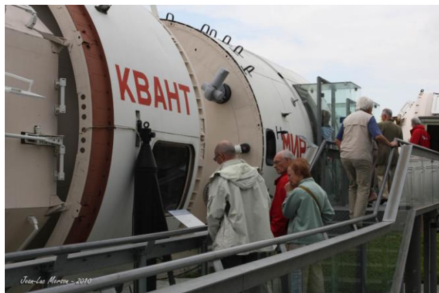
Les Masters et leurs épouses découvrent la station russe Mir avec ses drôles de surfaces dédiées au sport, au travail, au sommeil.

C'est ensuite par bus que nous rejoindrons en fin de matinée la Cité de l'Espace. Nous démarrons cette visite par un film en 3D réalisé en 1999 lors d'une mission de réparation du télescope spatial Hubble. Images fantastiques dans l'espace, comme si nous y étions. Un vrai régal. Puis, déjeuner agréable au restaurant de la Cité, suivi d'une visite du parc avec trois guides qui, maquettes en vraie grandeur à l'appui, nous expliqueront tout sur Spoutnik, Ariane, la station Mir, la station ISS internationale. On pourra même admirer une pierre de lune ramenée par un équipage américain.