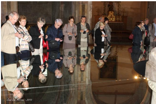
Les Masters admiratifs devant le miroir qui reflète le « palmier des Jacobins », vaste pilier d'où partent 26 portants de voûte.